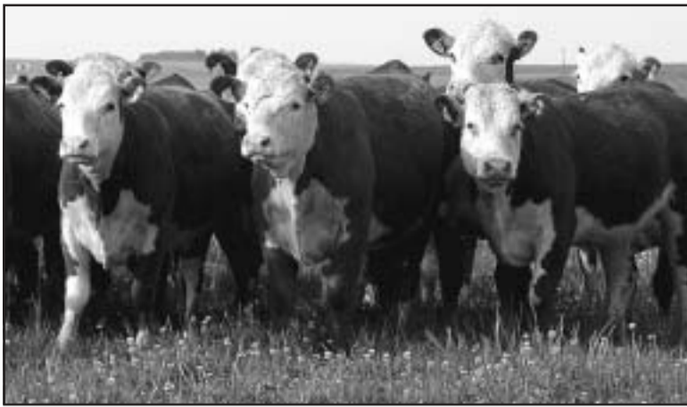
Pecuária foi tema de evento apoiado pela Comissão de Jovens

Conforme o estudo, mais de 40% dos produtores da Campanha Sudeste e Meridional têm ciclo completo, enquanto que, na Serra do Sudeste e nos Campos de Cima da Serra, a maior parte dedica-se à cria. A maior parte dos participantes da pesquisa, 35,7%, se identificou como produtor rural. Um número pequeno identificou-se como agricultor. Na Campanha Sudeste, o índice sobe para 42,9%. Mais de 70% dos entrevistados informaram que tiveram acesso à terra por meio de herança. Nos Cam-