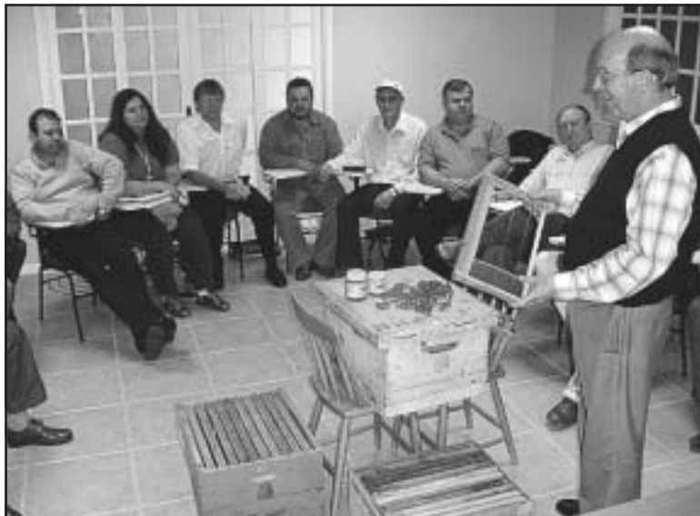
Ao longo de 2006, foram realizados nivelamentos de instrutores

Entre os treinamentos do Senar-RS que mais ocorreram em 2006, conforme grupo de ações por ocupação no merca-