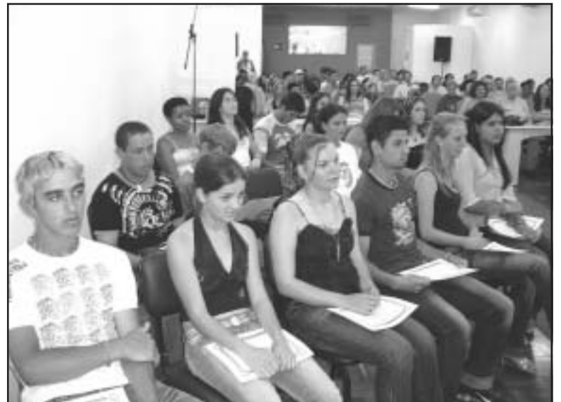
Cursos e treinamentos capacitam trabalhadores para buscar emprego

A proposta do Senar voltada para a nutrição e bem-estar do público rural fez com que milhares de trabalhadores participassem do curso de Aproveitamento Integral de Alimen-