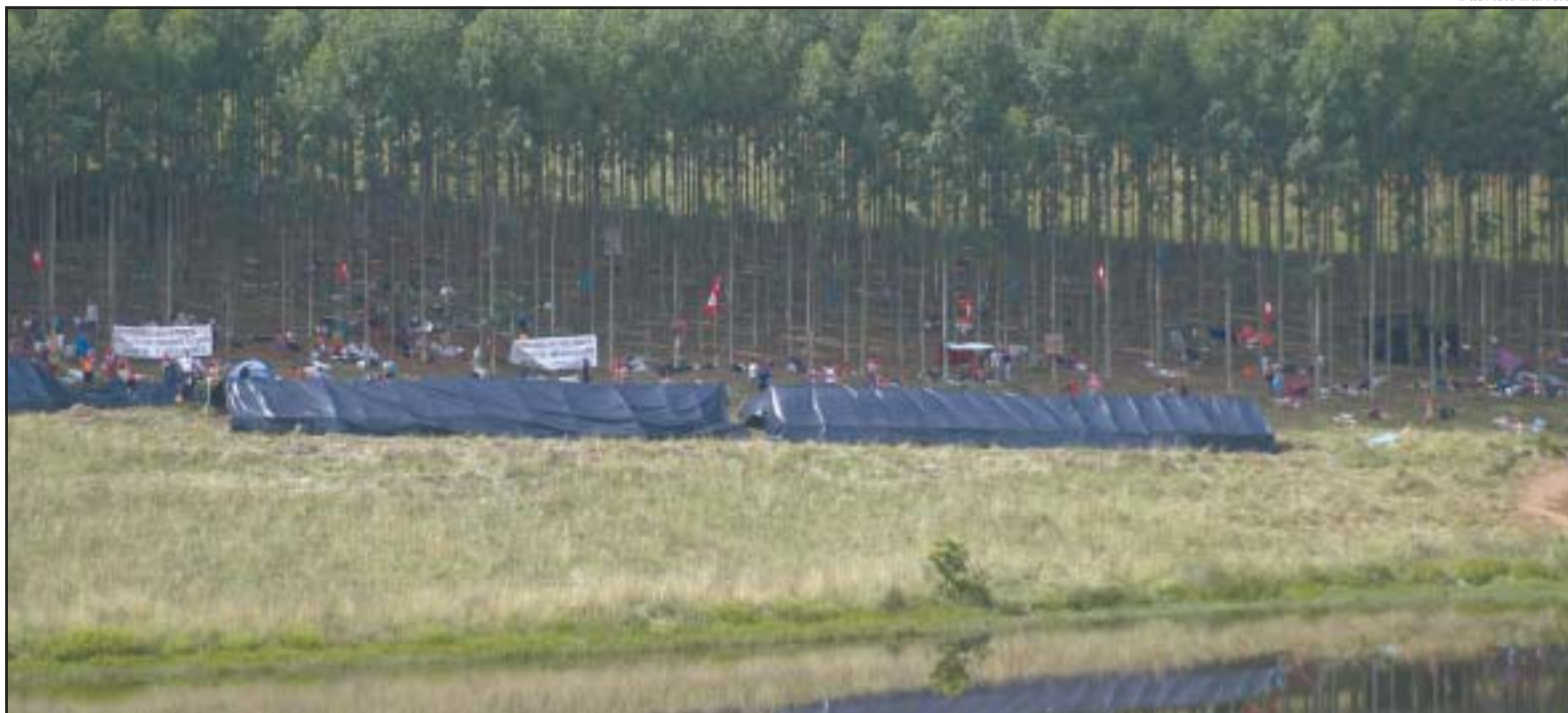
Manifestantes invadiram as propriedades e montaram acampamento junto às florestas, onde ergueram barracas de lona preta

As invasões ocorrem em protesto ao plantio de eucaliptos em áreas que poderiam ser destinadas a assentamento de agricultores e produção de alimentos. Os manifestantes afirmam que as empresas têm, juntas, mais de 200 mil hectares de terras no Estado. Em Eldorado do Sul, cerca de 300 pessoas de vários assentamentos e acampamentos do Estado invadiram a área da fazenda Cerro Alto, com aproximadamente cem hectares. O grupo chegou por volta das 5h. A propriedade é particular e o cultivo de eucalipto é feito em parceria com a Aracruz. Policiais da Bri-