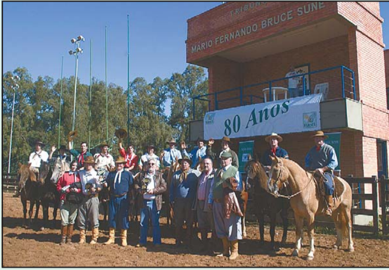
Participantes vieram de diversas regionais da Farsul

A integração campeira das regionais da Farsul no Estado marcou o segundo dia de comemorações pelos 80 anos da entidade, no Parque de Exposições Assis Brasil, em Esteio. Mais de 650 pessoas acompanharam as atividades da programação, que incluíram uma missa de ação de graças, almoço festivo, tertúlias e as provas de tiro de laço entre presidentes e as equipes dos sindicatos rurais.