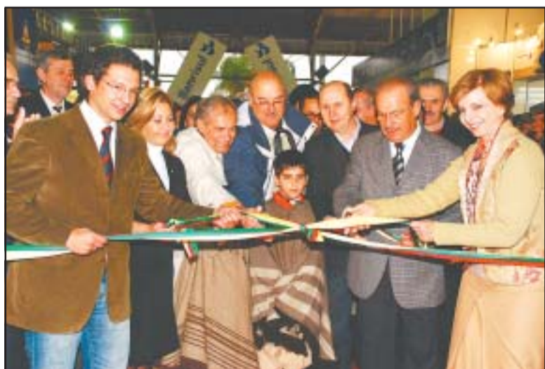
Chuva determinou que a abertura da feira fosse no Pavilhão Internacional