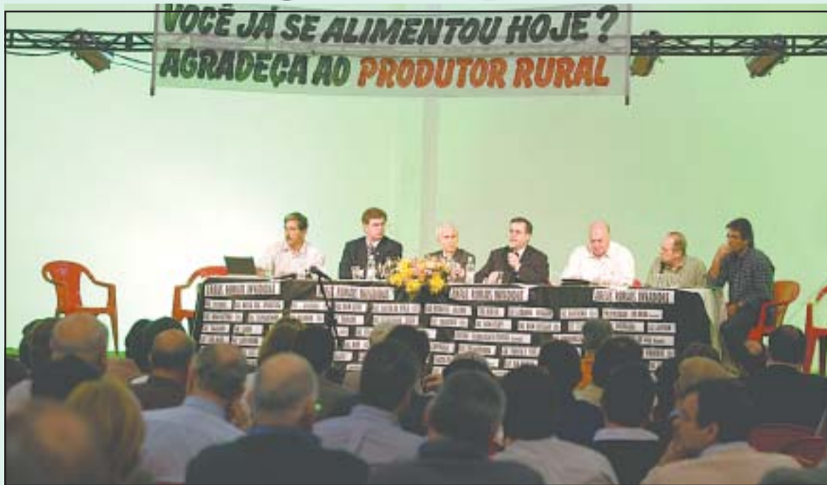
Associação Rural de Pelotas sediou a reunião que reuniu produtores rurais da zona sul do estado