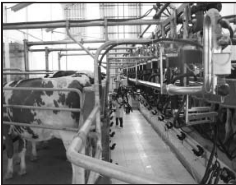
Custo operacional do litro é de R$ 0,64, segundo Conab

O custo operacional de produção de um litro de leite no Rio Grande do Sul é de R$ 0,64 para a pecuária empresarial, segundo estimativa da Conab. Atualmente, o preço mínimo para o Estado é de R$ 0,47 o litro. De acordo com a área técnica