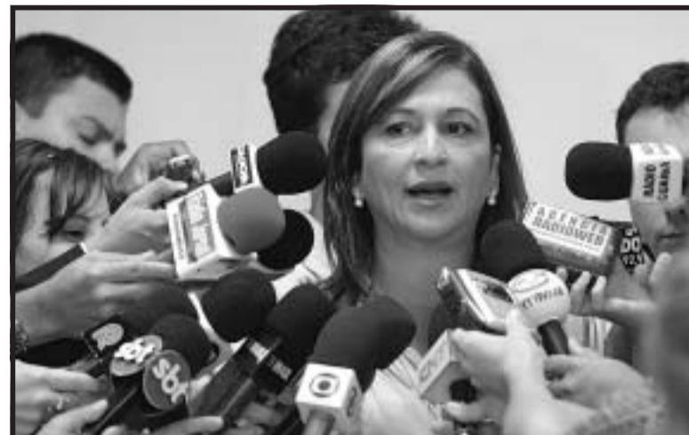
Presidente da CNA reivindicou liberação de R$ 155 milhões

A reestruturação do atual modelo de crédito rural é um dos principais itens desta proposta. A ideia é criar um instrumento que dê mais transparência fiscal e flexibilidade ao produtor para tomar financiamentos. Ela também revelou ao presidente outras propostas em debate no âmbito deste grupo de trabalho, como a criação de