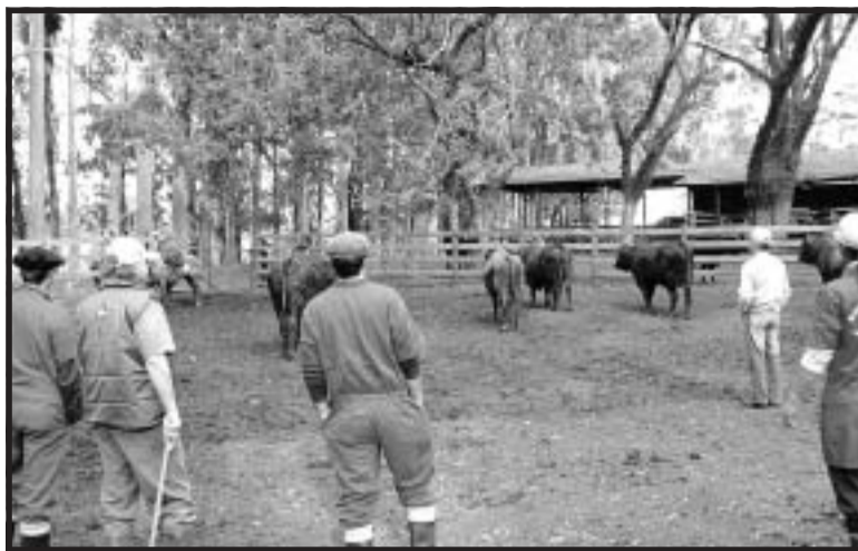
Trabalho a campo foi realizado por 28 veterinários credenciados