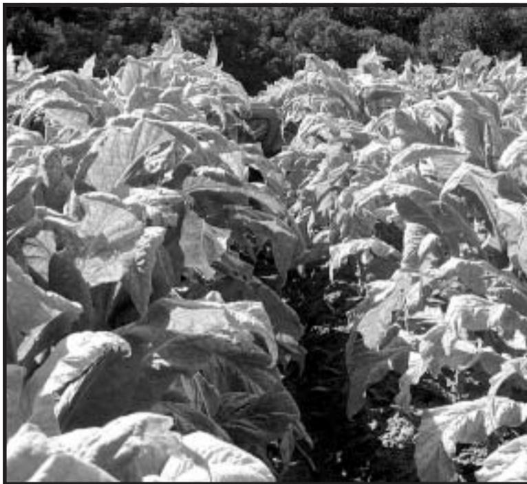
Exportação de fumo e seus produtos teve aumento de 54%

Houve crescimento também no valor das exportações do complexo sucroalcooleiro, que passou de 703 milhões de dólares para 855 milhões de dólares, motivado pelo salto de 39,7% nas exportações de açúcar no mês de junho se comparado ao mesmo período de 2008, e chegou à cifra de 706 milhões de dólares. Cresceu também preço e quantidade